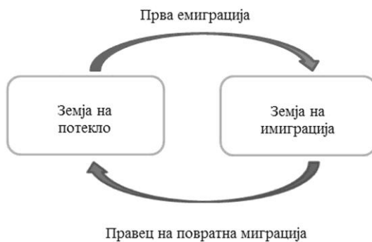
Слика 2: Повратна емиграција (втора категорија)